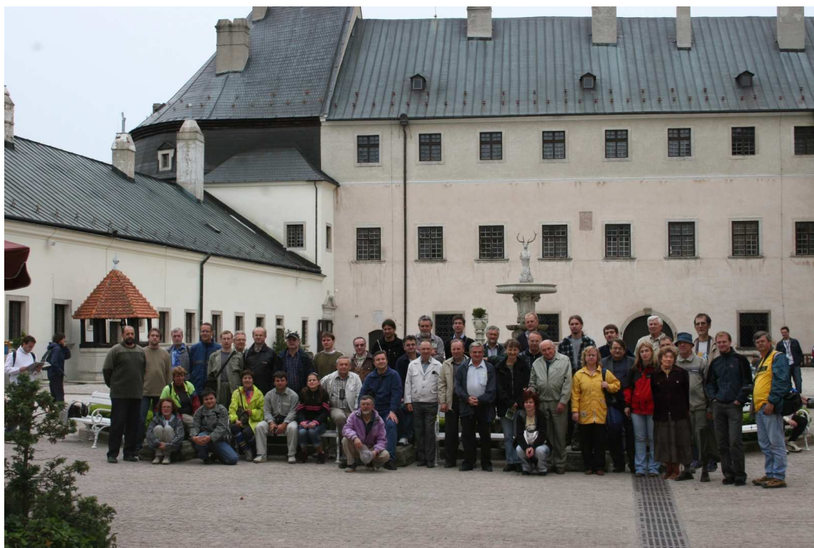
Účastníci 18. slnečného seminára Modra 2006 - exkurzia, Hrad Červený Kameň.