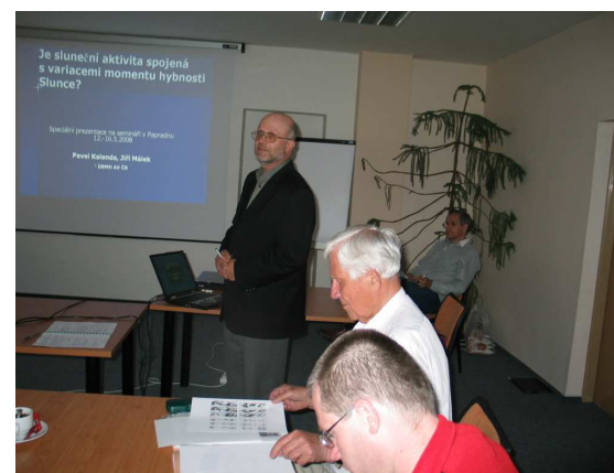
19. slnečný seminár (Papradno 2008) – počas prednášok.