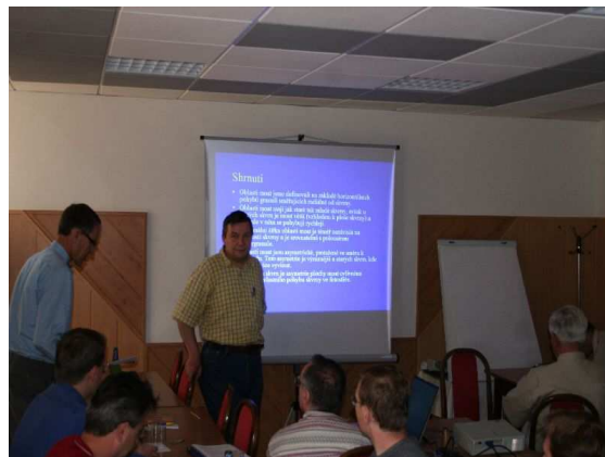
18. slnečný seminár – počas prednášok.